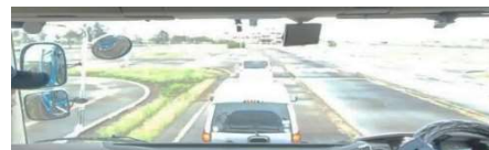
発進時 直前の車や二輪車を見落としやすい