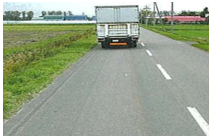
トラックの運転視界