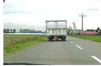
乗用車の運転視界